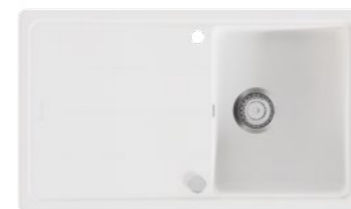
Fragranit Spüle - Franke Basis BFG 611-6