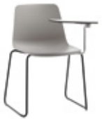
Sled base Pie de varilla + writing tablet / pala escritura