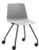
4 leg base Base 4 patas + casters / ruedas