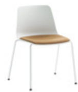
Fixed seat panel Asiento tapizado fijo