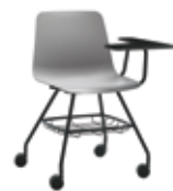
4 leg base Base 4 patas + casters / ruedas + writing tablet / pala escritura