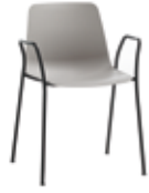
4 leg armchair Sillón 4 patas