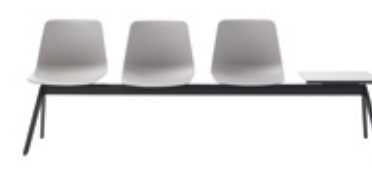
Bench 2-5 seater Banco 2-5 plazas