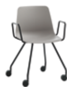
4 leg base Base 4 patas + arms / brazos + casters / ruedas