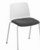
Removable soft seat pillow Almohada de asiento desenfundable