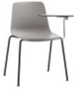
4 leg 4 patas + writing tablet / pala escritura