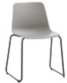
Sled base Pie de varilla