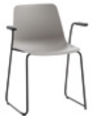
Sled base armchair Sillón pie de varilla