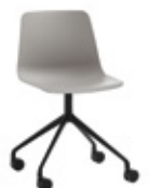
Aluminum swivel base Base giratoria de aluminio + casters / ruedas