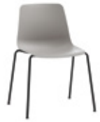
4 leg Silla 4 patas