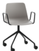
Aluminum swivel base Base giratoria de aluminio + arms / brazos + casters / ruedas