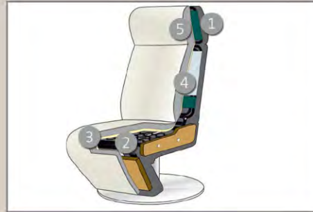
Het hier getoonde model van de doorsnede komt niet overeen met het model op deze bladzijde van de catalogus.