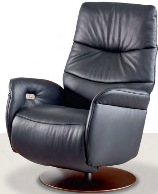
Cover: Z73/99 black

[Model L] kan manueel of elektrisch ergonomisch versteld worden en omgevormd worden tot een super comfortabele relax fauteuil . Verschillende poten zijn verkrijgbaar in verscheiden metaaltinten .