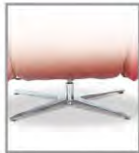
4-spaaks poot meerprijs 3 zithoogtes