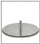
Draaibasis Verschillende metaalkleuren meerprijs 3 zithoogtes