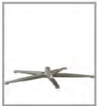
5-spaaks voet Verschillende metaalkleuren 3 zithoogtes