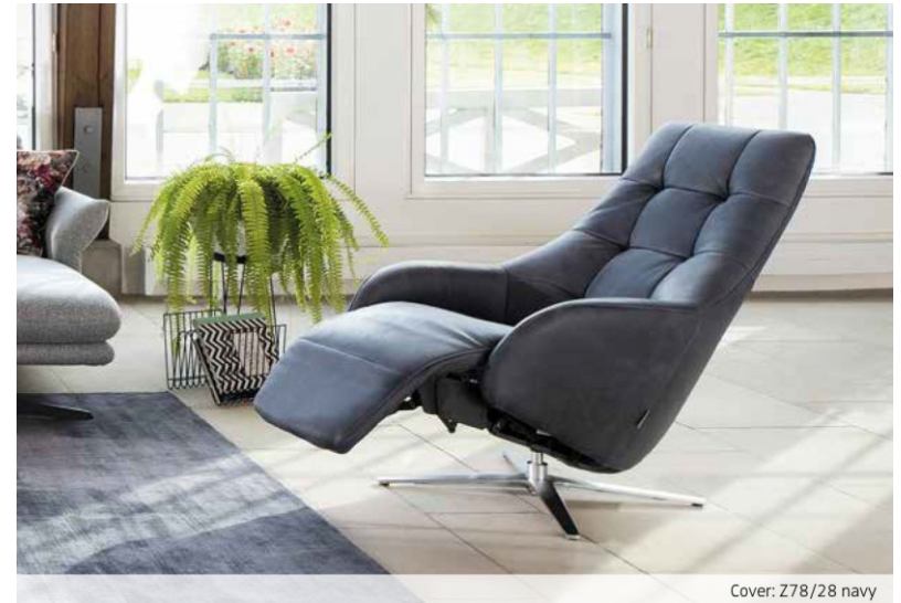
Cover: Z78/28 navy