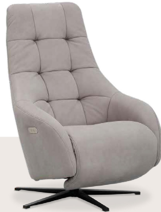
Cover: Z78/21 steel

De hoofdsteun is traploos verstelbaar en de 4- en 5-sterpoten zijn verkrijgbaar in verschillende metallic tinten. In de leren uitvoering kan een contrasterende kleur draad worden besteld.