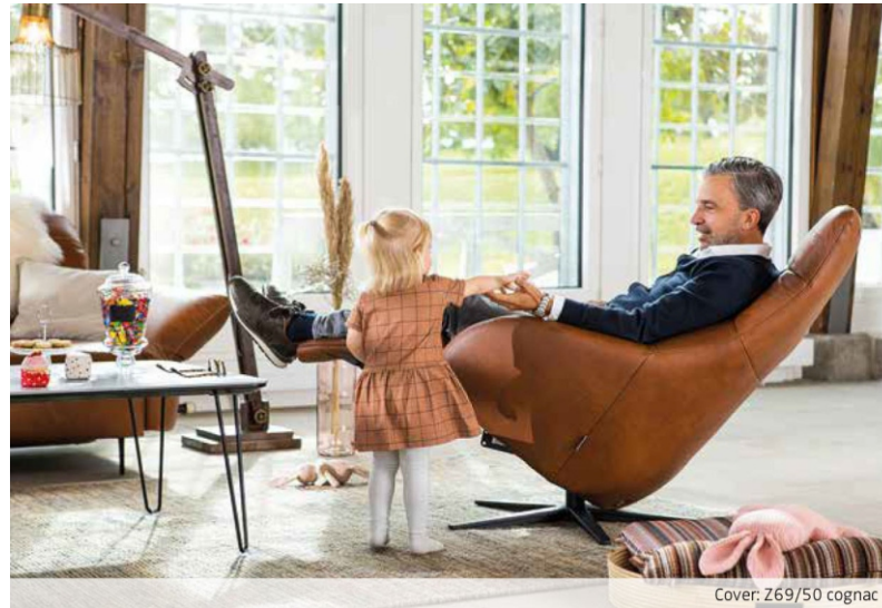
Cover: Z69/50 cognac