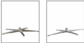
5-spaaks voet Verschillende metaal kleuren F 99 4-spaaks poot meerprijs satijn nikkel F 1D

Metaal kleuren Sommige van de metalen poten zijn verkrijgbaar in verschillende metaalkleuren. Gelieve de kleur aan te geven bij bestellen. Poedercoating De kleuren M21 zilver, M56 brons, M95 antraciet en M99 zwart zijn gepoedercoat.