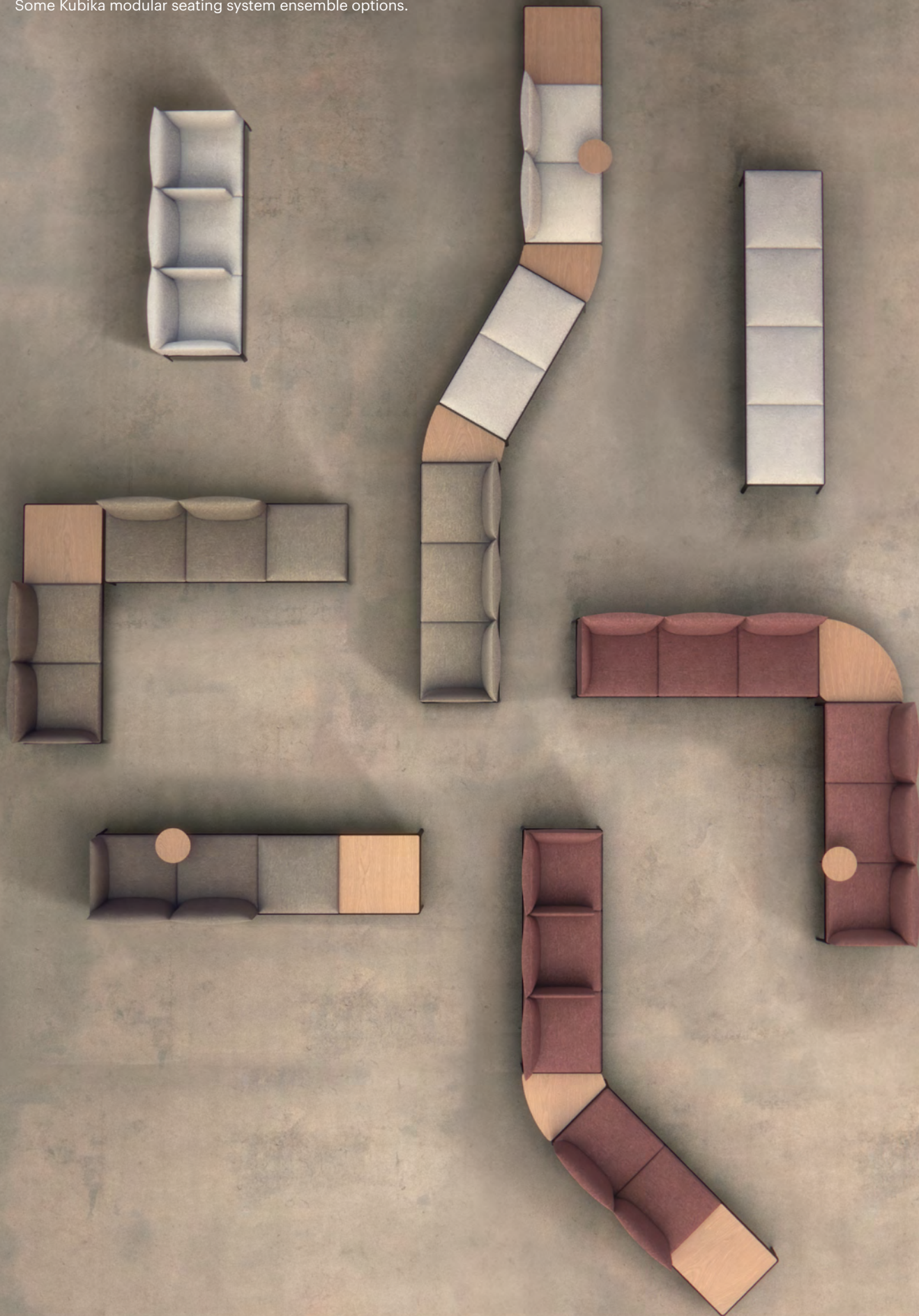
Some Kubika modular seating system ensemble options.