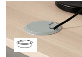
Kabeldoorvoer: Afmeting: 69 x 74 mm Top: Rechthoekig (Optioneel)