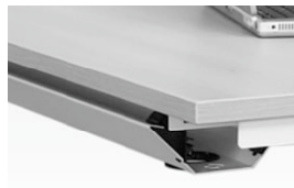
Horizontale Kabelbaan voor: 160 cm Bureaublad 180 cm Bureaublad 200 cm Bureaublad