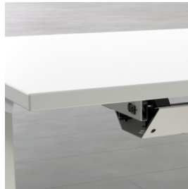
Horizontale Kabelgoot (Optioneel)