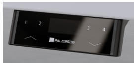
Bediening: Up & Down with Display and Memory (Optioneel)