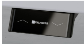
Bediening: Up & Down (Standaard)