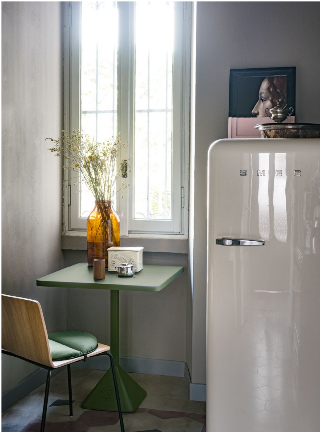
TNP table Bistro