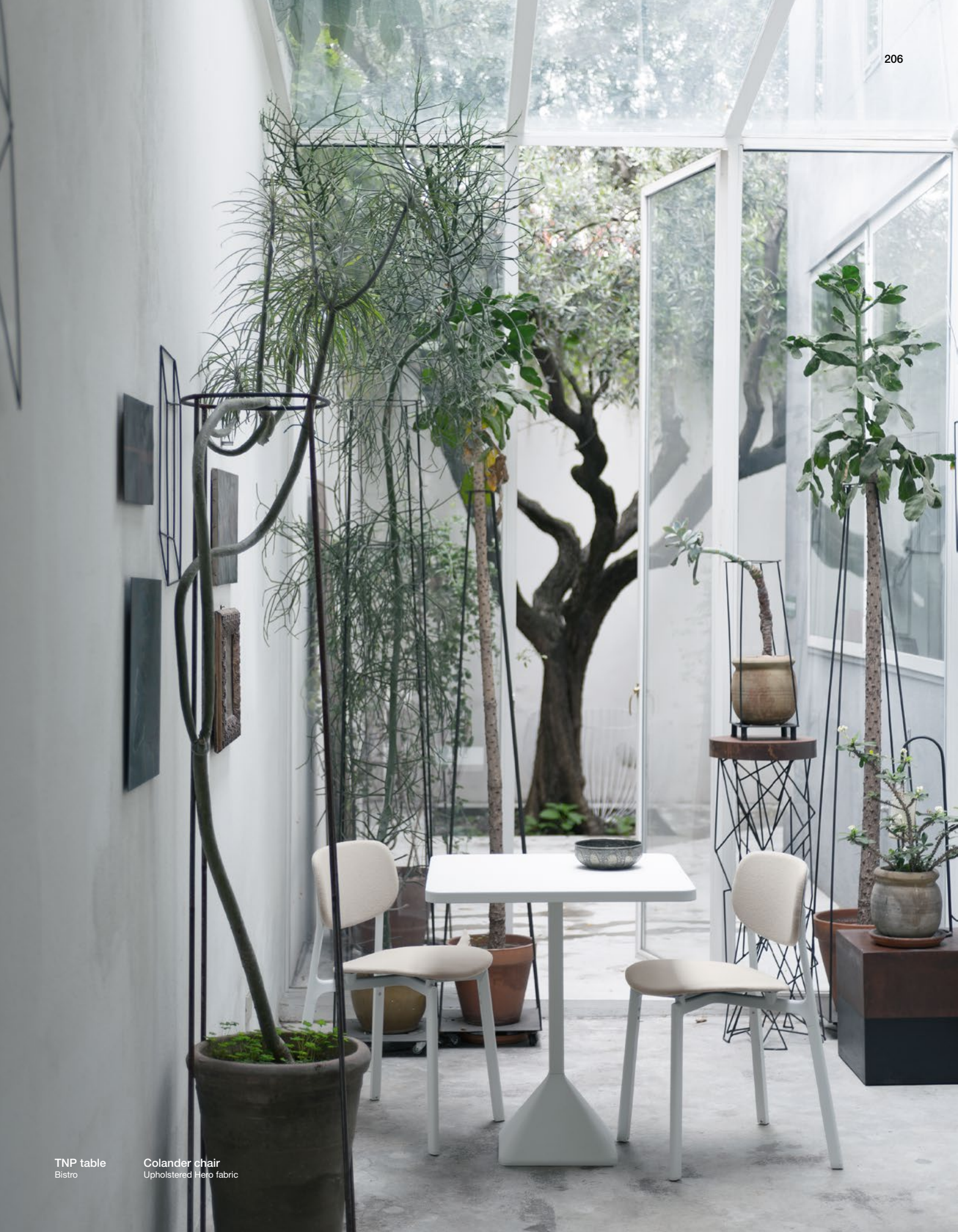
TNP table Bistro