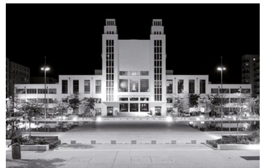
TNP – Villeurbanne, France