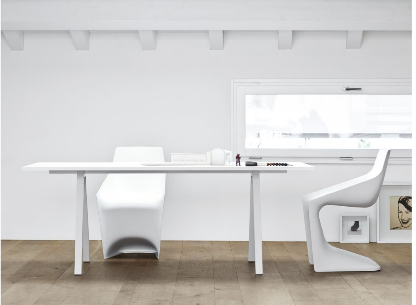
Neat table Fenix-NTM® top