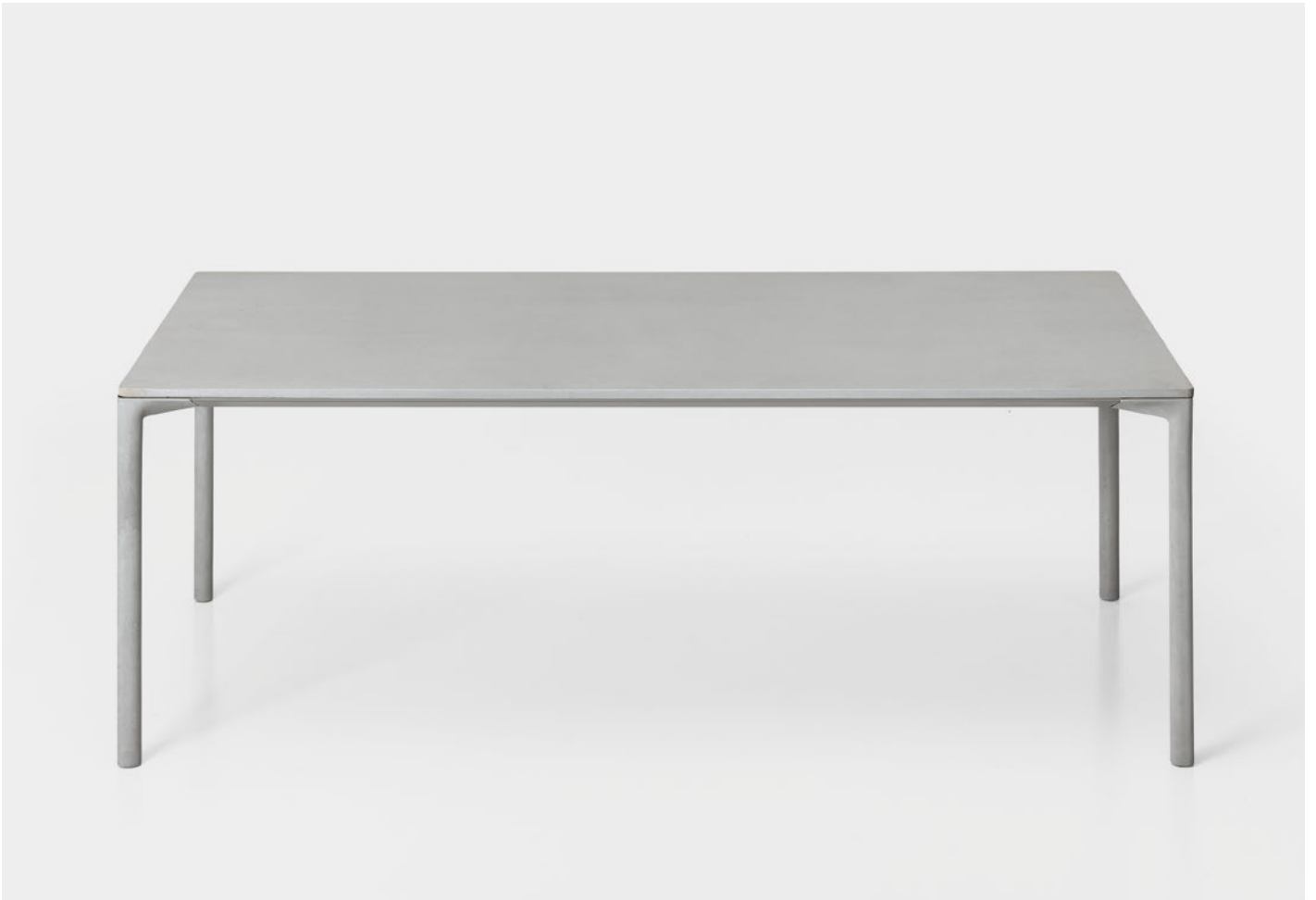
Boiacca table Cement version