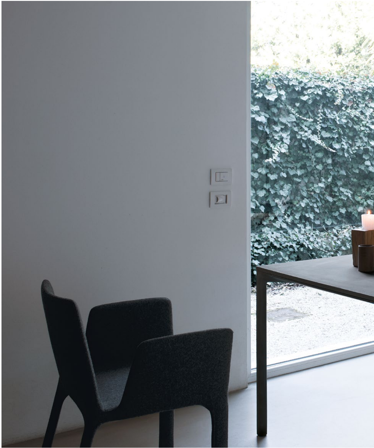
Boiacca table Cement version