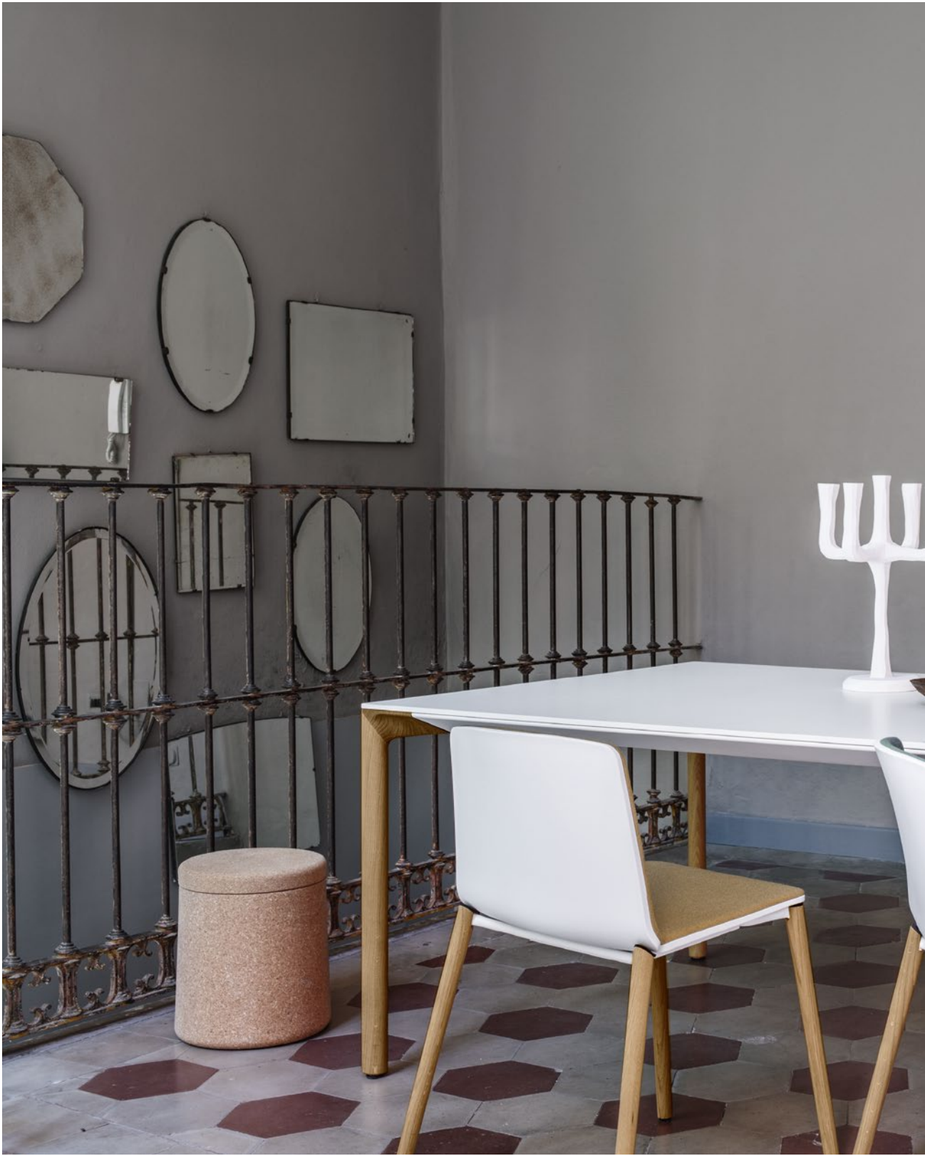
Boiaccia table Wood version