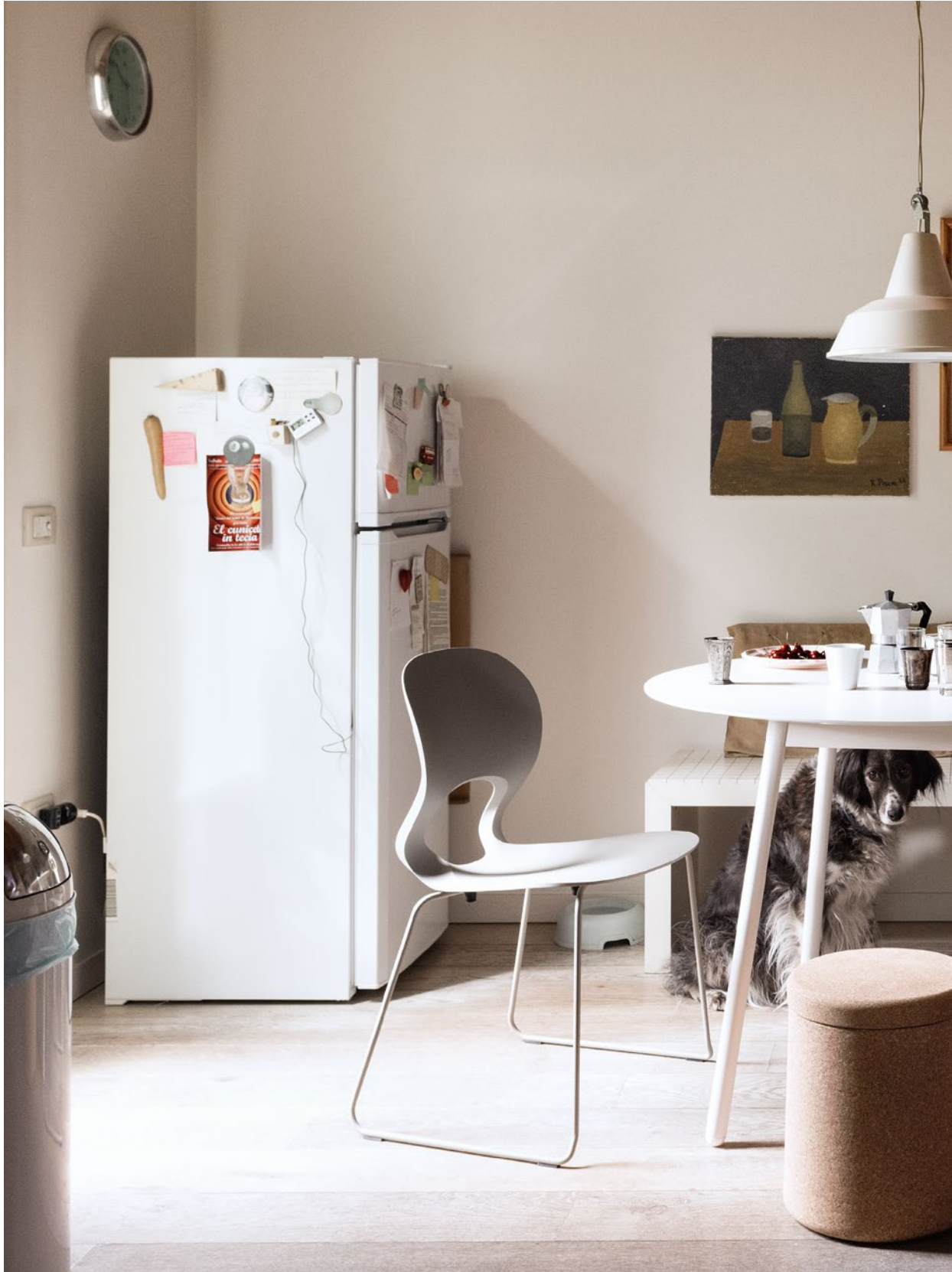
BNC table Laminate top