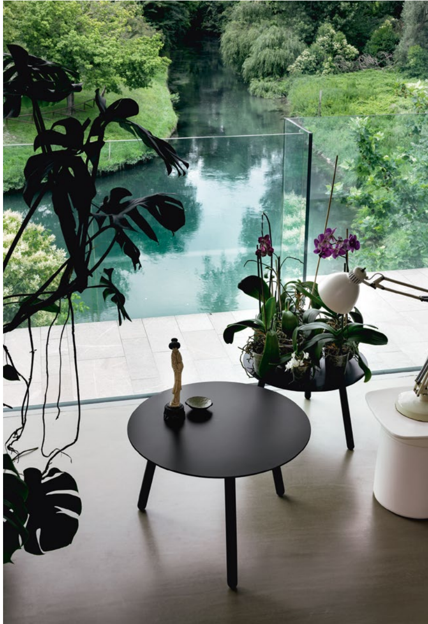
BNC occasional table Laminate top