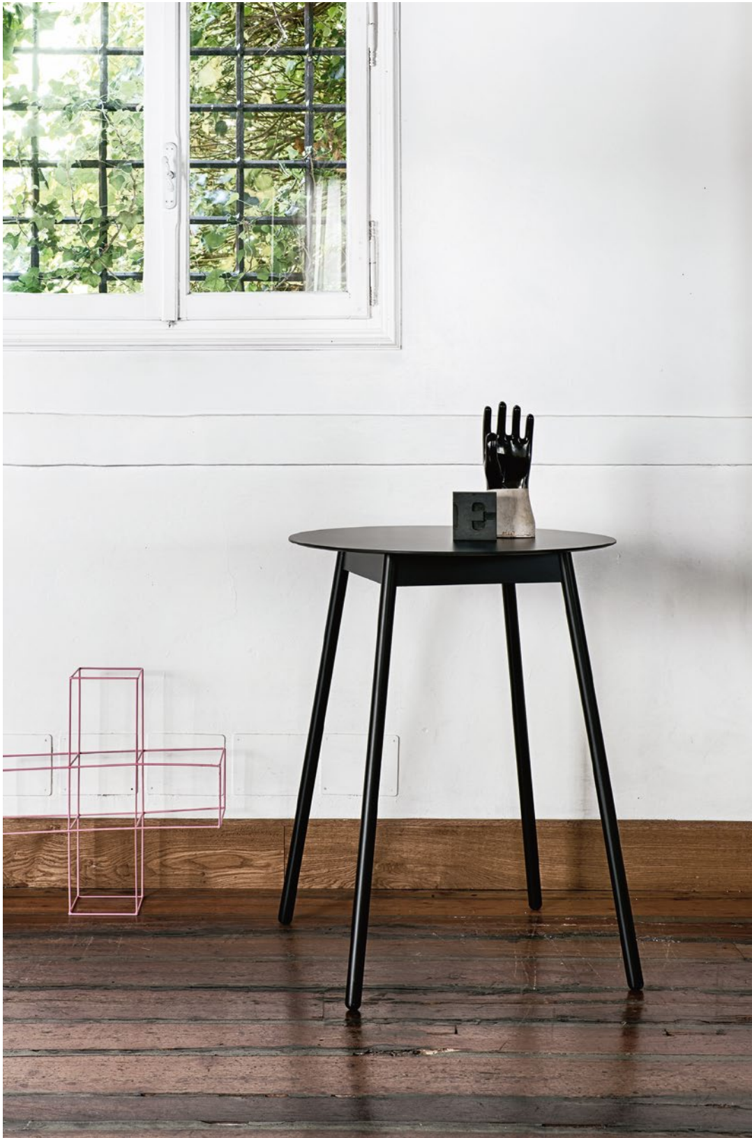
BNC high table Laminate top