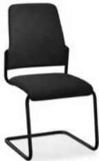
500G / 510G