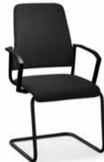
550G / 560G

DE_Goal Besucher- und Konferenzstühle EN_Goal visitors' and conference chairs FR_Goal sièges de conférence et visiteur NL_Goal bezoeker- en conferentiestoelen ES_Goal sillas para confidentes y de visitas IT_Goal seduta per visitatore e da conferenza